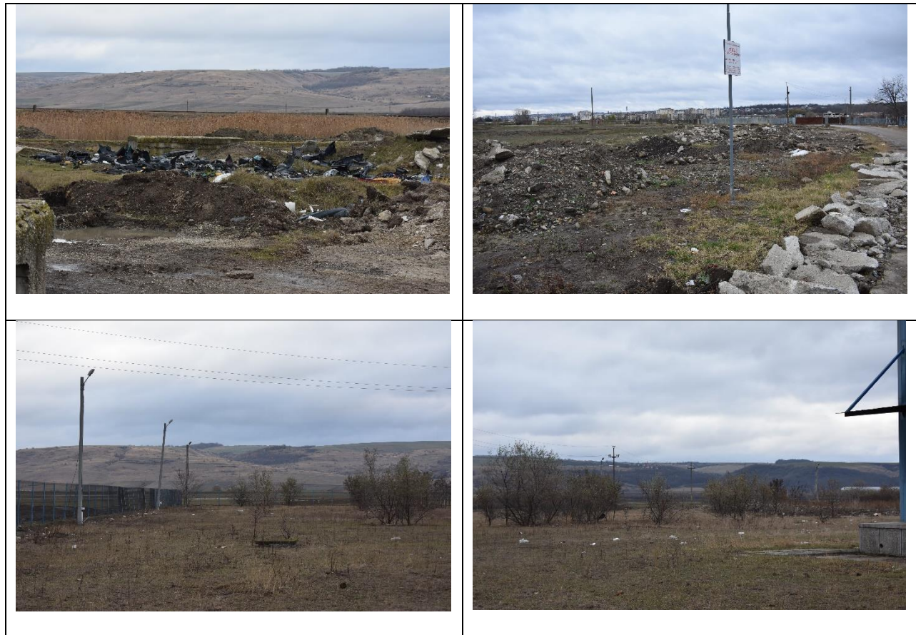
Figure 3. Imagini din perimetrul analizat