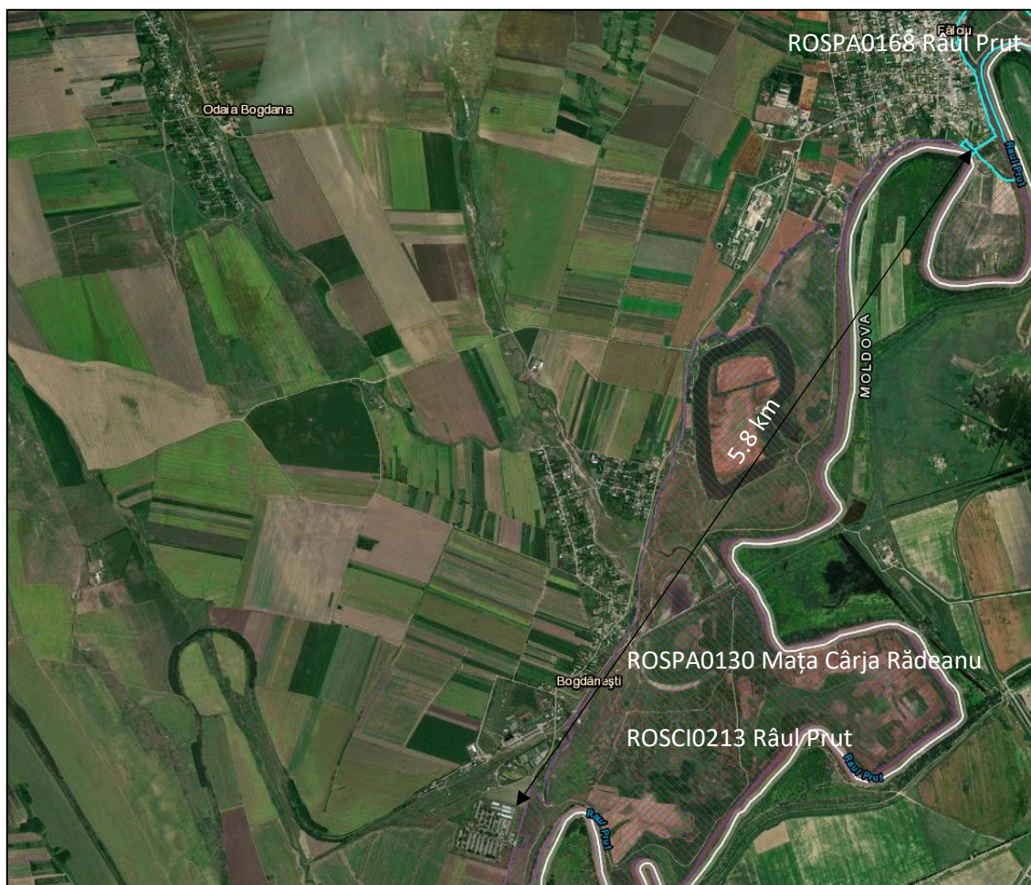
Amplasarea in raport cu siturile Natura 2000