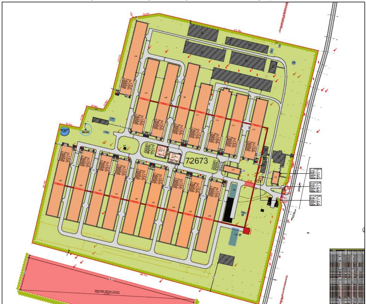
Plan situație propusă