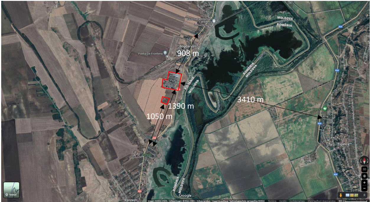
Distanțe față de zonele locuite