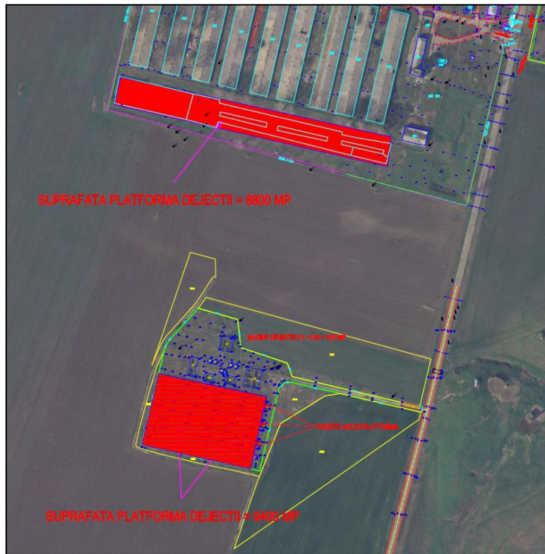
Amplasarea celor 2 platforme pentru colectarea dejețiilor