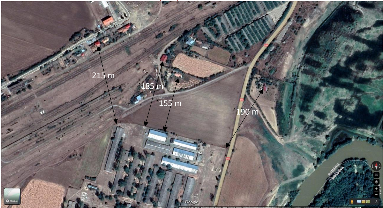
Detaliu privind vecinătățile relevante