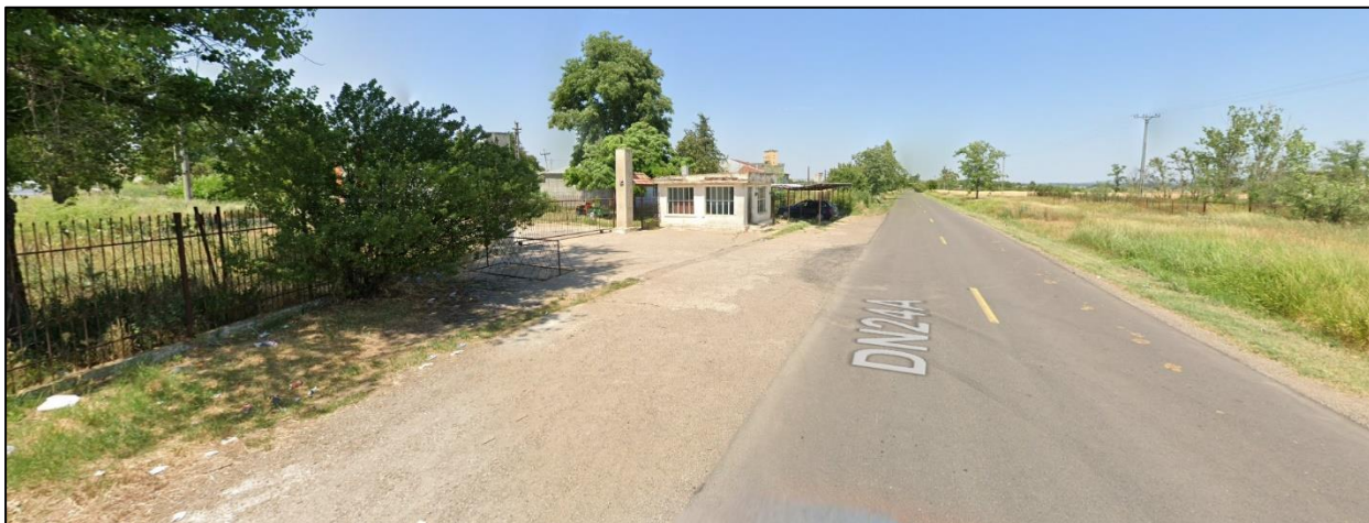
Acces auto pe parcela - existent si păstrat