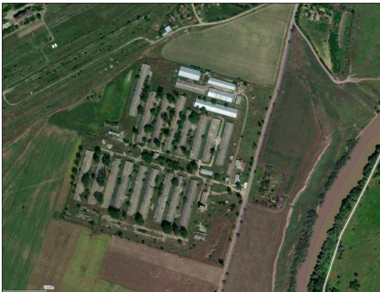
Plan situație existentă

Planul de situație cât și planurile detaliate ale proiectului sunt atașate prezentei documentații.